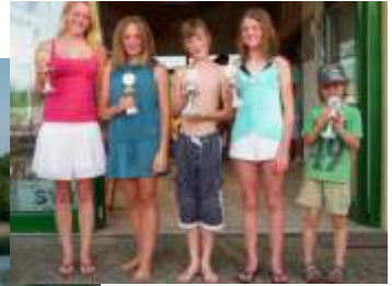
Regatta- geschehen 2010