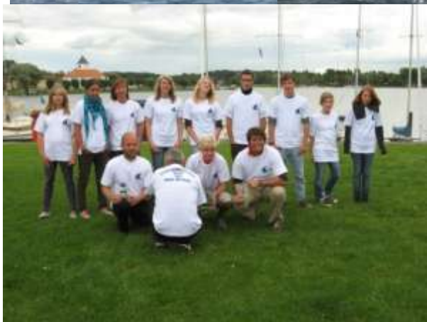
Saarland-Meisterschaft Laser-Standard 2010