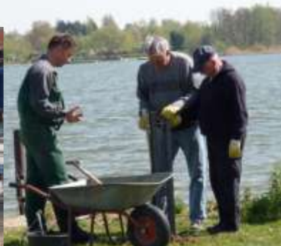
Arbeitseinsatz am Hafen